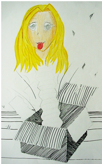
Abb. Jack in the box